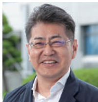
樋口 裕思 北陸先端科学技術大学院大学 産学官連携客員教授

「オープンイノベーション活動に必要な人材と、 ニーズとシーズをベストマッチさせる方法」