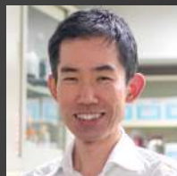
園下 将大 北海道大学 遺伝子病制御研究所 がん制御学分野 教授