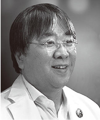
一般財団法人 未来医療推進機構 理事長 大阪警察病院 理事長・病院長、 大阪大学大学院特任教授