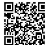
京都市産技研メールマガジン