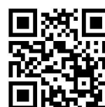
京都バイオ計測センター

http://tc-kyoto.or.jp/contact/mail/mail2014.html